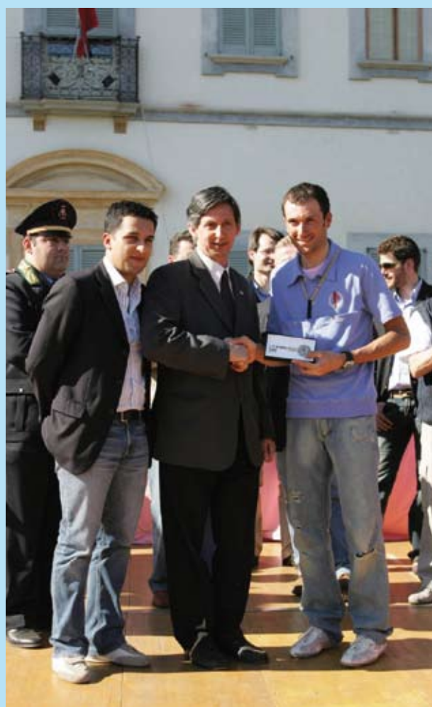
Consegna chiavi della città di Cassano Magnago a Ivan Basso 06-06-2006

L'Amministrazione Comunale di Cassano Magnago è vicina a Ivan Basso perché la vicenda in atto ci lascia al quanto esterrefatti.