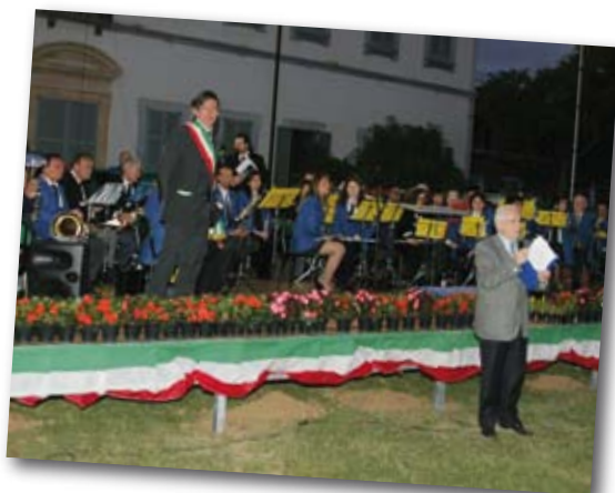
Celebrazione 2 giugno 2006 al Parco della Magana