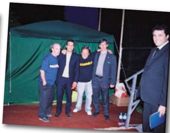
Spettacolo dei Fichi d'India al Parco della Magana - 11.06.2206