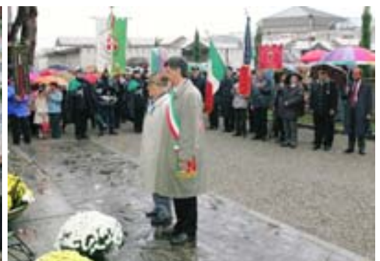
Festa dell'Unità Nazionale - 06.11.2005