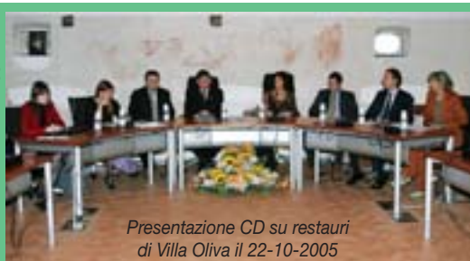
Presentazione CD su restauri di Villa Oliva il 22-10-2005